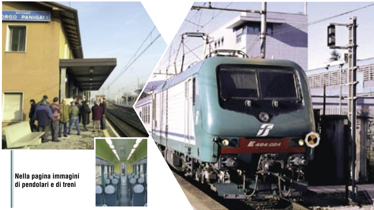
Nella pagina immagini di pendolari e di treni

Casteldebole sarà servita da nuovi treni del Servizio Ferroviario Metropolitano. Grazie ad un importante investimento sul territorio i treni che da Bologna partono e arrivano da Porretta Terme e Vignola avranno fermate anche a Casteldebole, inserendo anche tratte notturne. La rivoluzione partirà il 14 dicembre, ancora l'orario esatto della partenza dei treni dalla stazione del Servizio Ferroviario Metropolitano di Casteldebole non si conosce, ma le tratte sono già state assegnate. Verrà infatti ag-