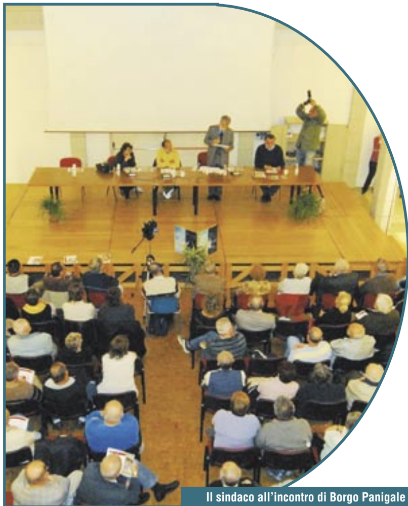
Il sindaco all'incontro di Borgo Panigale

*Presidente del Quartiere Borgo Panigale