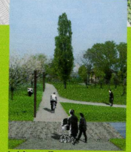
4_ dal parco Tanara: attraversamento di via del Carpentiere