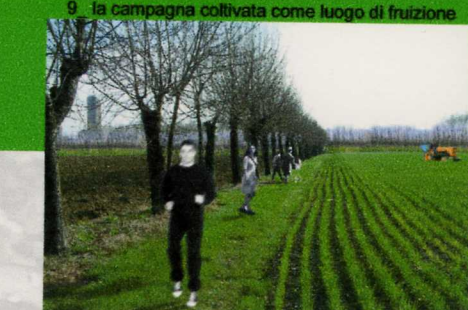
9_ la campagna coltivata come luogo di fruizione