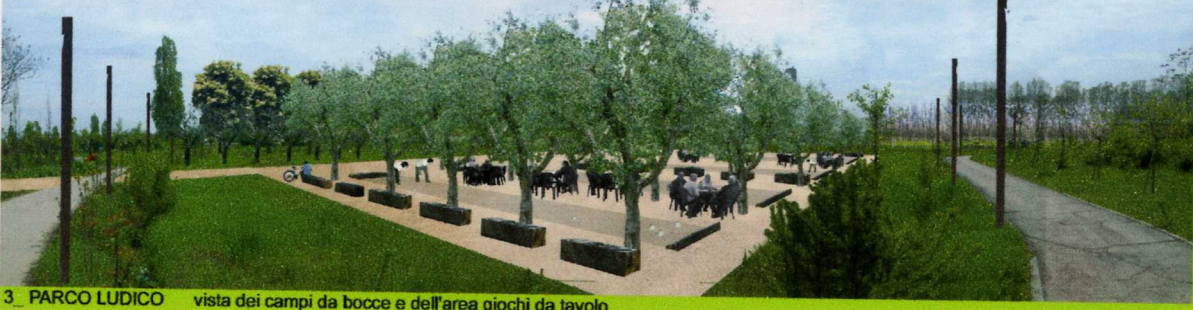
3_ PARCO LUDICO vista dei campi da bocce e dell'area giochi da tavolo