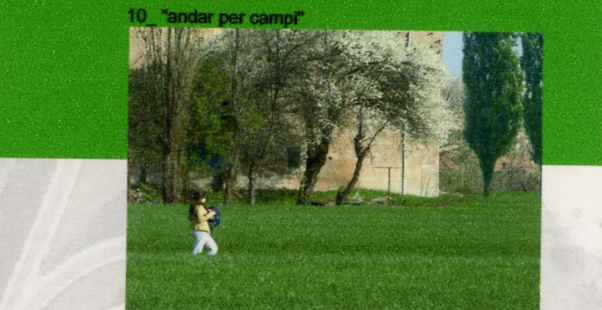
10_ "andar per campi"