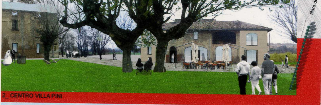
2_ CENTRO VILLA PINI