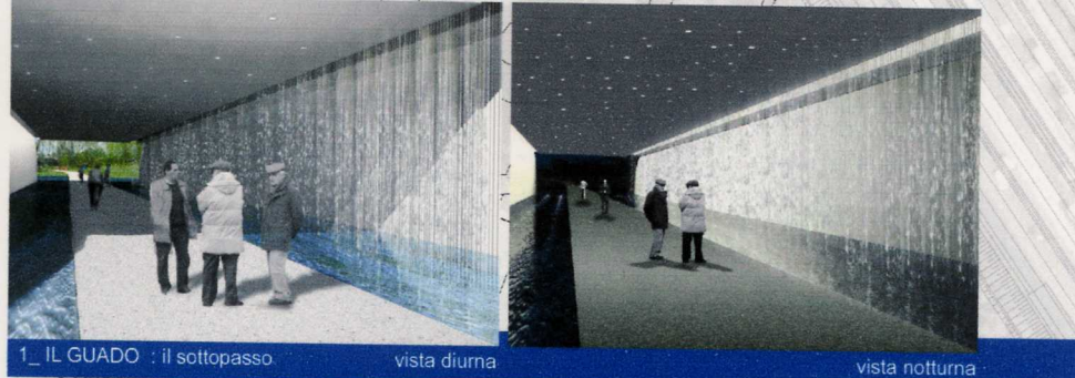
1_ IL GUADO : il sottopasso vista diurna vista notturna