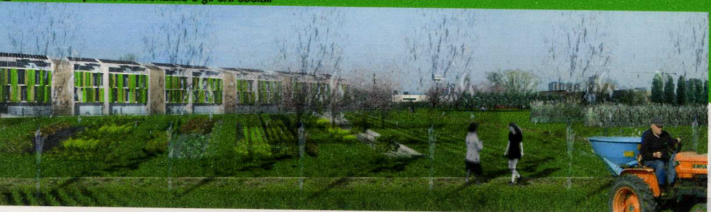
8_ il nuovo complesso residenziale e gli orti sociali