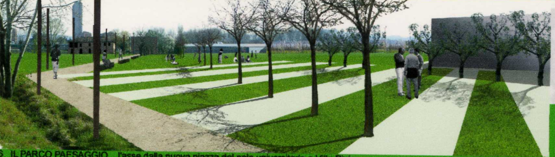
6_ IL PARCO PAESAGGIO l'asse dalla nuova piazza del polo universitario a Villa Pini