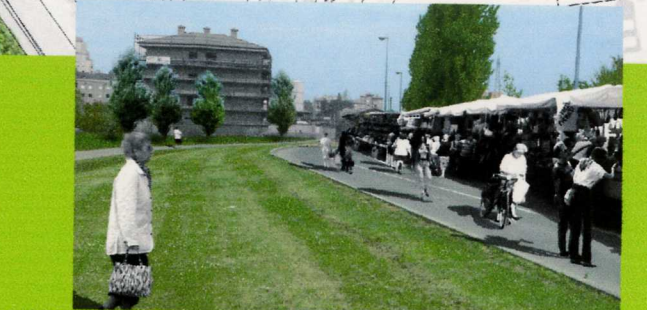
5_ via del Carpentiere come mercato settimanale