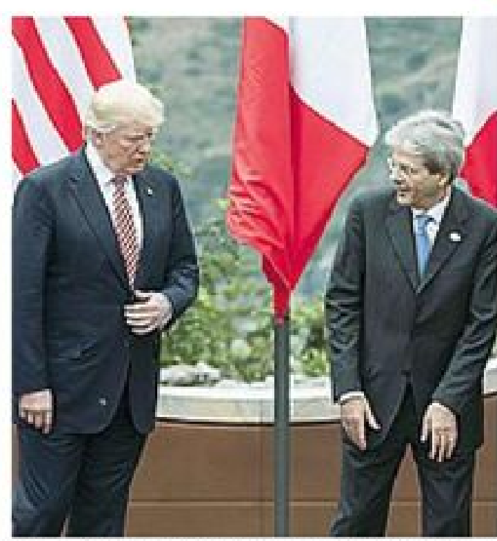
Donald Trump e il premier Paolo Gentiloni a Taormina