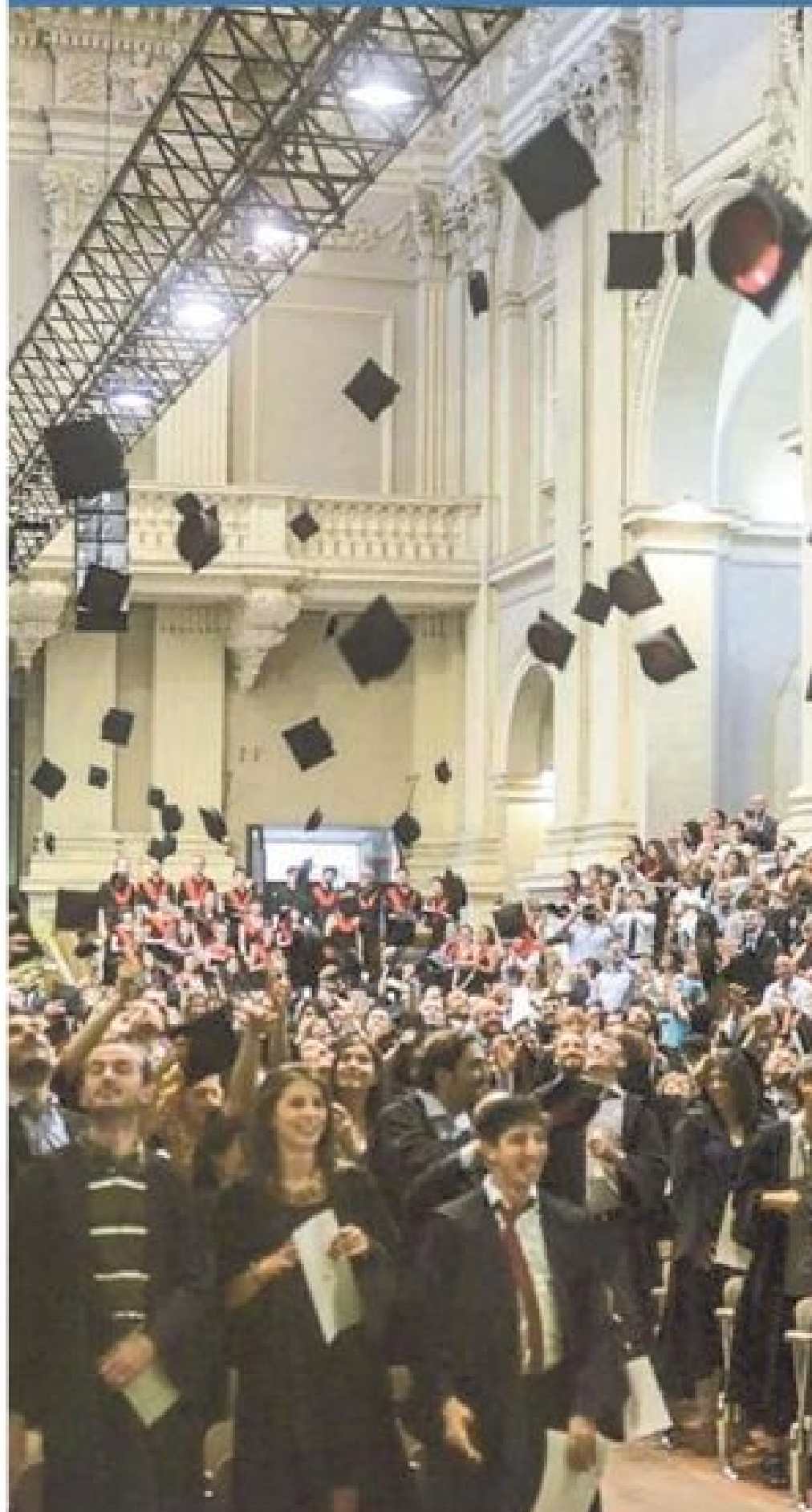
La cerimonia di proclamazione dei dottorandi