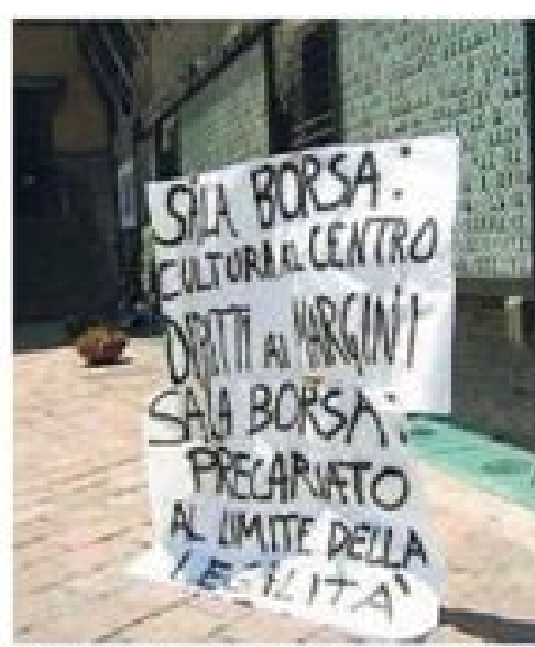
Il manifesto davanti a Sala Borsa