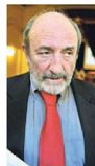
Il filosofo Umberto Galimberti

Ti guadagnerai il pane col sudore della tua fronte», disse Dio ad Adamo cacciato dal paradiso. Il lavoro fu la prima maledizione per l'uomo, ma ora è una benedizione quando lo si ha. E di lavoro si parlerà oggi al Mast di via Speranza 42 che, con la fondazione Giangiacomo Feltrinelli, ha organizzato un incontro di cui sarà protagonista il filosofo Umberto Galimberti.