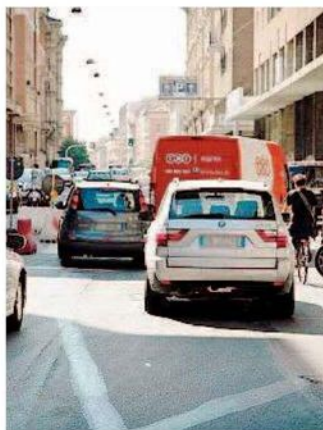
Traffico in via Imerio