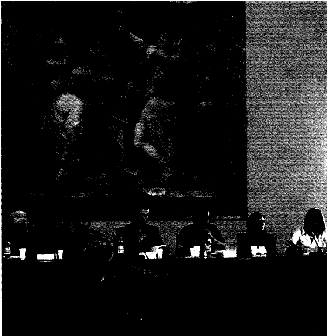
Fig. 2 Bologna, Palazzo D'Accursio 15 aprile 2009: la presentazione del volume in Cappella Farnese

si apre con un denso saggio di R. Ferretti ( Quale sviluppo per l'Appennino? Le vie della modernizzazione economica nella montagna tra Idice e Reno ), in cui l'autore passa in rassegna i diversi "percorsi