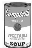
Associazione Il Barattolo