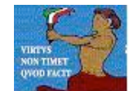
ADMIU - Endas Bologna