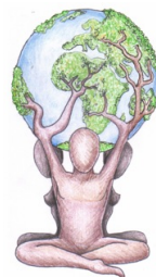
Associazione Universitaria Citizens Network