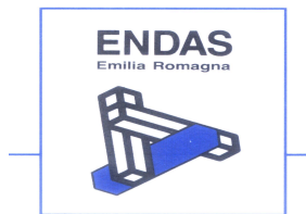
ENDAS Emilia Romagna