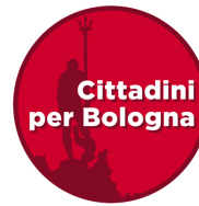
Cittadini per Bologna