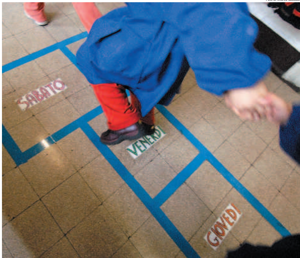
Giochi in una scuola dell'infanzia

Questo mentre la Chiesa si prepara alla festa di giovedì primo ottobre, il «Materna day»: 2000 bimbi delle materne cattoliche in piazza Maggiore per giocare e fare co-