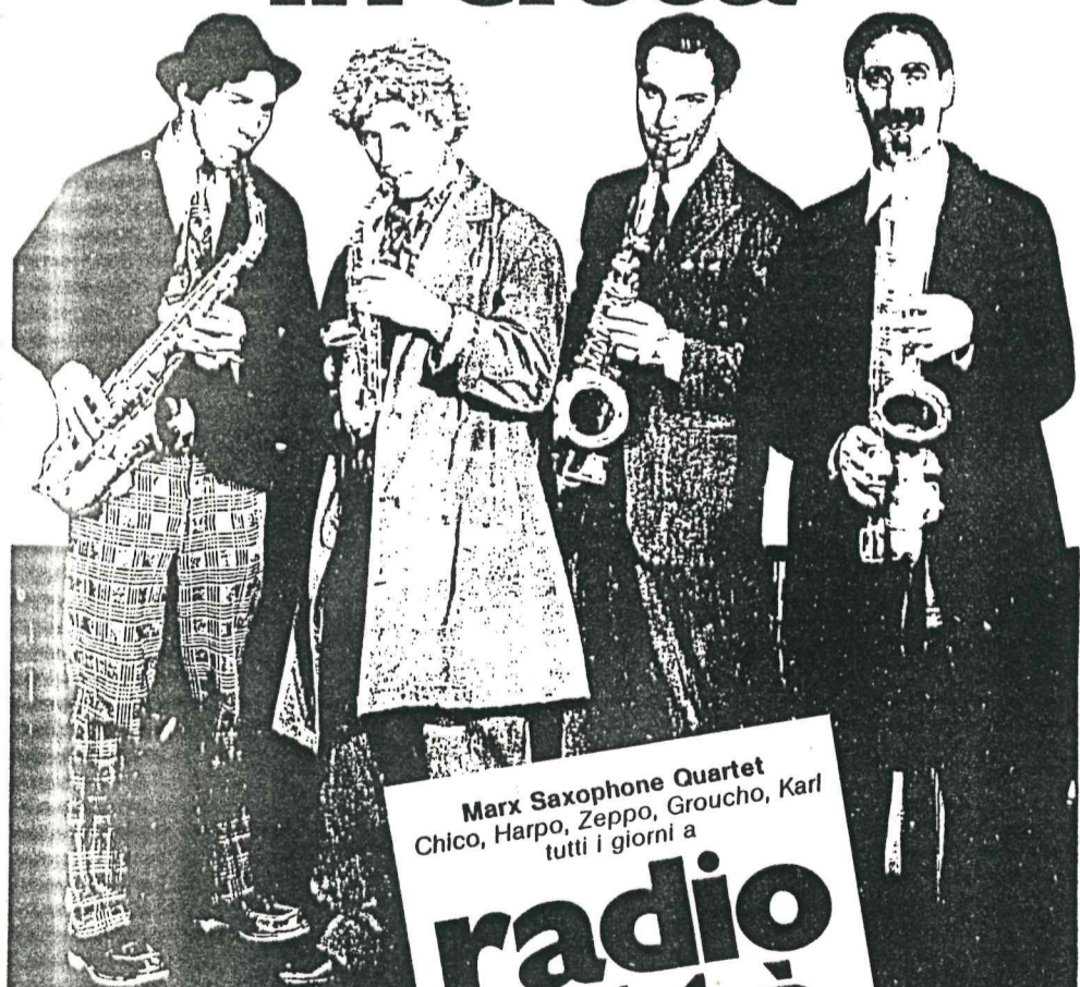
Marx Saxophone Quartet Chico, Harpo, Zeppo, Groucho, Karl tutti i giorni a