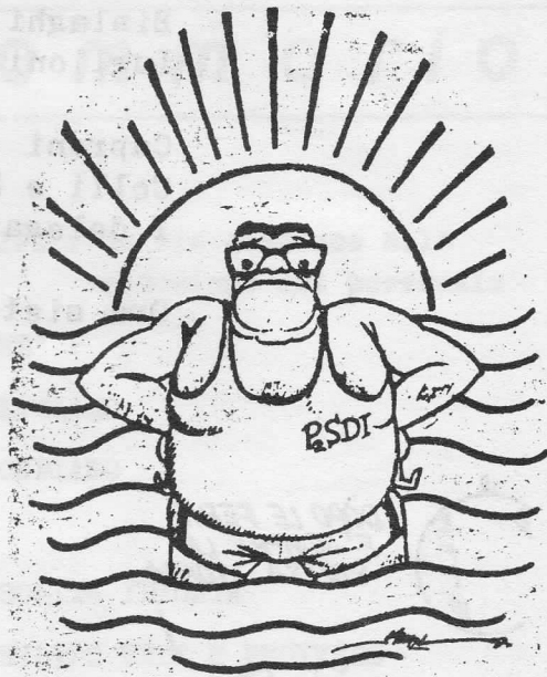
ESEMPIO DI GRASSO SUPERFLUO

Le cause di questi eccessi alimentari sono molteplici: la spinta consumistica, dimostrazione di agiatezza e successo e inoltre ricorso al cibo come rifugio da situazioni di insicurezza, stati d'ansia